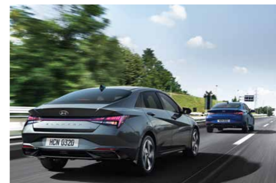
Điều khiển hành trình