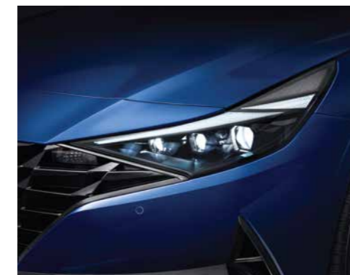
Đèn chiếu sáng LED (Phiên bản 1.6 AT/2.0 AT/N Line)

Thiết kế khác biệt với phần lưới tản nhiệt “Parametric Dynamics” tạo thiết kế mạnh mẽ, góc cạnh, thể thao cho Elantra