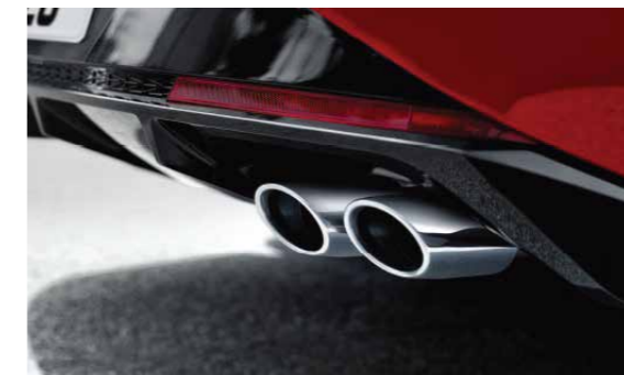
Chụp ống xả kép thể thao