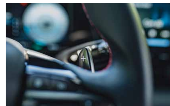
Lẫy chuyển số sau vô lăng