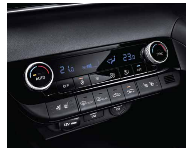
Điều hòa tự động