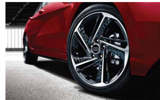
Vành hợp kim 18 inch