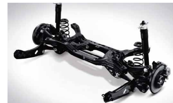
Hệ thống treo sau liên kết đa điểm