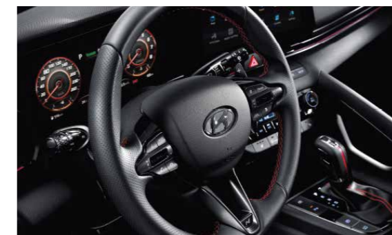
Vô lăng 3 chấu thù chỉ đỏ