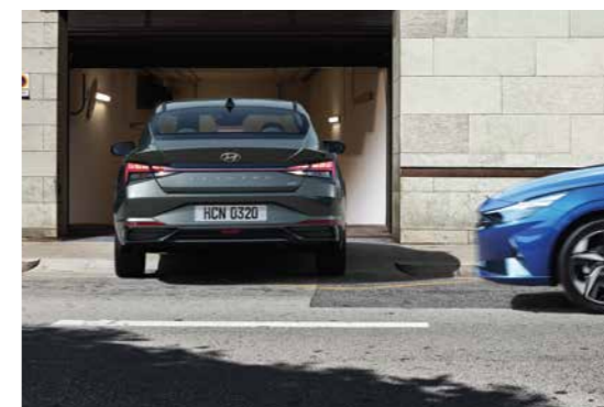
Cảm biến lùi