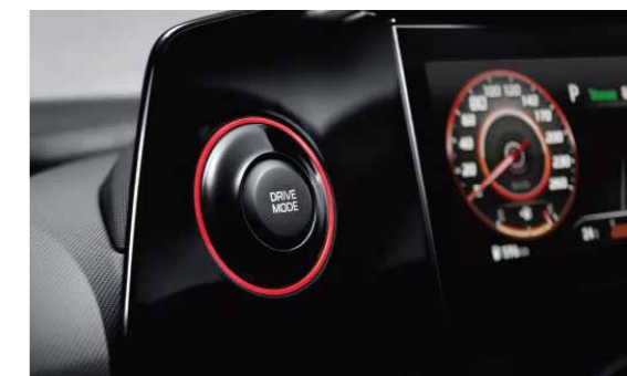
Nút bấm chuyển chế độ lái