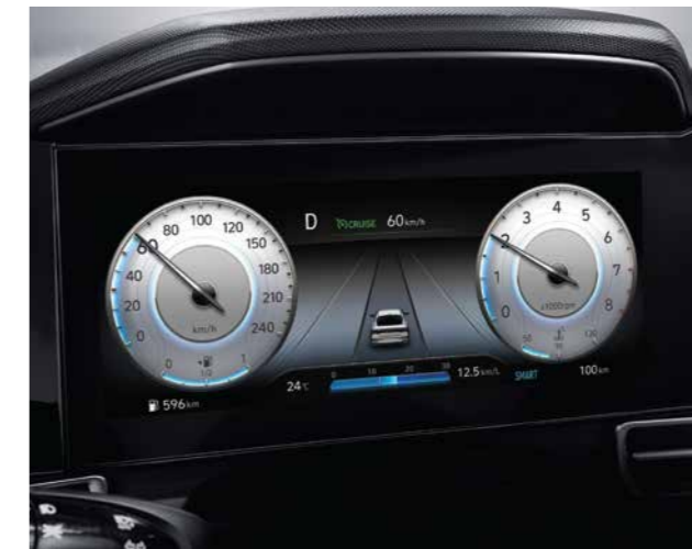
Màn hình thông tin digital 10.25 inch