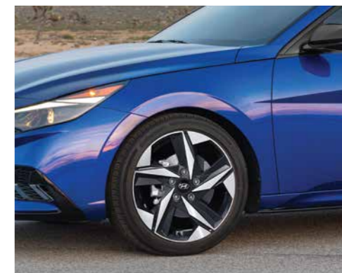
Vành hợp kim 17 inch 2 tone màu (Phiên bản 2.0 AT)