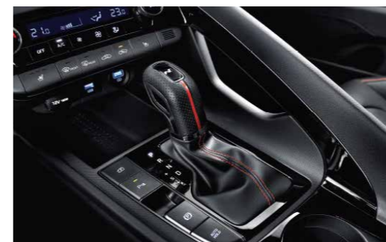
Cần số thể thao N Line