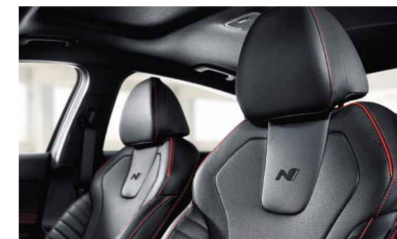
Ghế da thể thao N Line