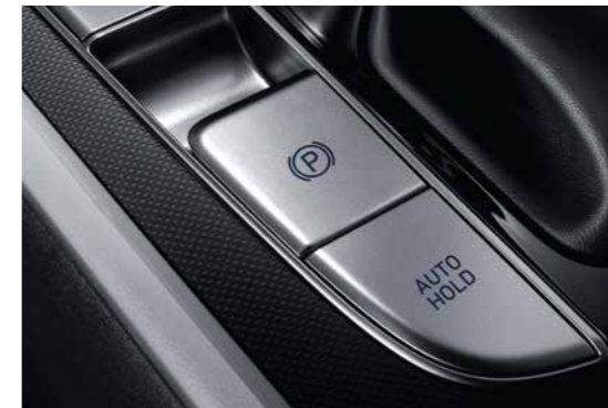
Phanh tay điện tử