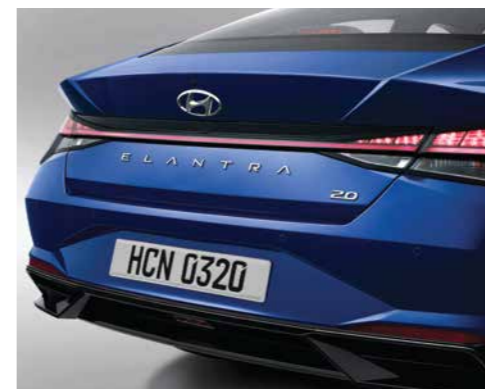
Cụm đèn hậu dạng LED (Phiên bản 1.6 AT/2.0 AT/N Line)