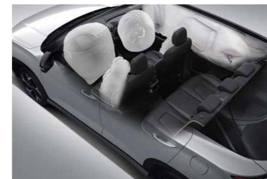
6 túi khí