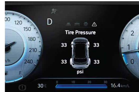
Hệ thống cảm biến áp suất lốp

Elantra hoàn toàn mới được trang bị khung gầm hoàn toàn mới để đảm bảo sự chắc chắn đi cùng hệ thống an toàn. Bên cạnh đó, động cơ Smartstream 1.6 T-GDi mới giúp Elantra trở thành chiếc xe mạnh mẽ nhất phân khúc