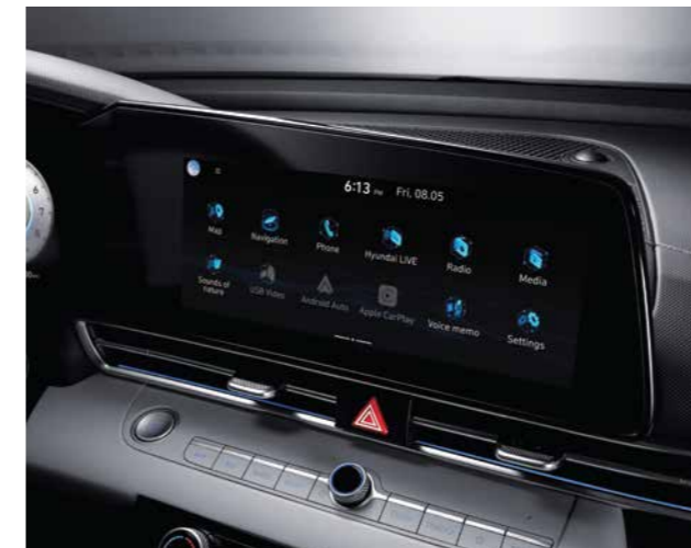
Màn hình giải trí 10.25 inch

Với các đường nét đơn giản nhưng đầy tính thể thao gợi cảm, All New Elantra mang đến một không gian nội thất hài hòa cùng không khí thể thao tràn ngập trong khoang lái