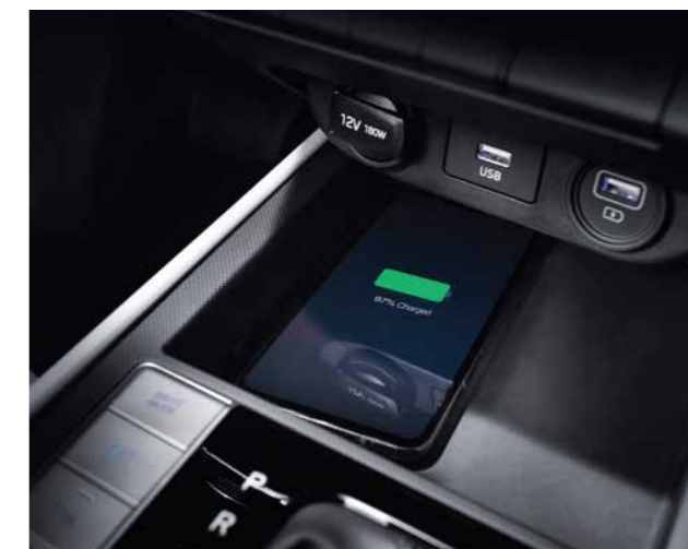
Sạc không dây