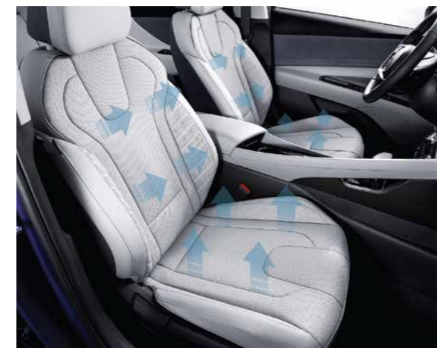
Sưởi và làm mát ghế