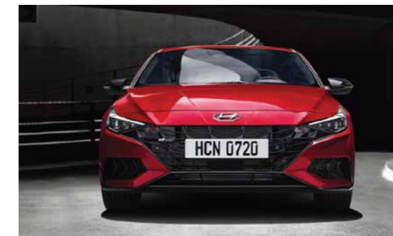
Cản trước với hốc hút gió lớn