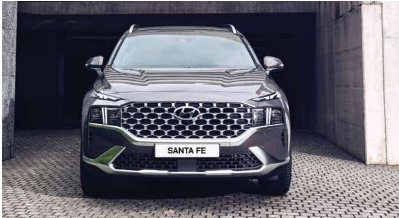
Thiết kế phá cách với lưới tản nhiệt mạ crom to bản Cascading Grill đặc trưng cùng cụm đèn chiếu sáng AHB LED