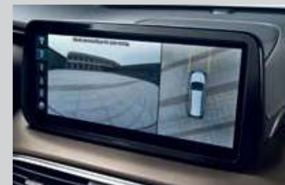
Hệ thống camera 360° (Bản Cao cấp)