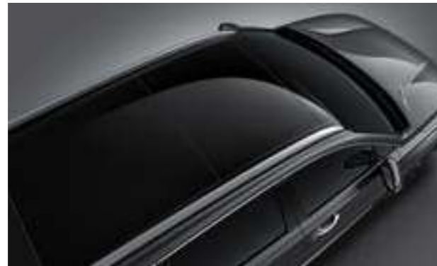
Cửa sổ trời toàn cảnh Panorama cùng thanh treo giá nóc (Bản Đặc biệt và Cao cấp)