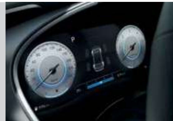
Màn hình thông tin digital 12.35 inch (Bản Đặc biệt và Cao cấp)