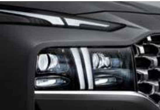
Đèn định vị ban ngày (DRL) tạo hình chữ T kéo từ nắp capo xuống hết cụm đèn chiếu sáng