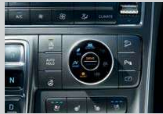
4 chế độ lái (Eco, Comfort, Sport, Smart)