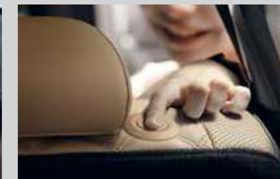
Gập ghế hàng 2 tiện lợi