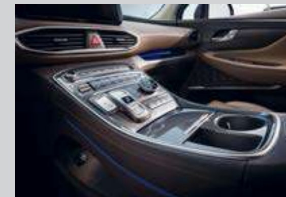
Cần số điện tử dạng nút bấm cùng đèn viền ambient light