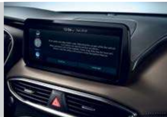
Màn hình giải trí 10.25 inch

Không gian nội thất của New Santa Fe là sự kết hợp hoàn hảo của sự sang trọng cùng với công nghệ hiện đại mang đến cho khách hàng sự tiện nghi thoải mái