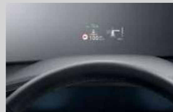
Hiển thị thông tin trên kính lái HUD (Bản Cao cấp)