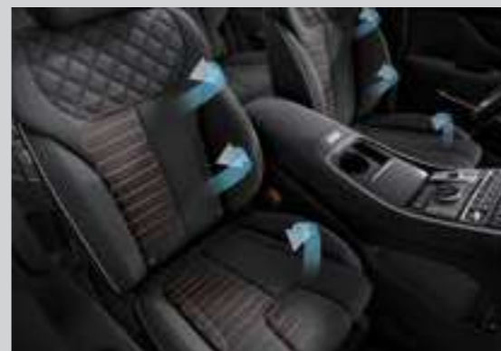
Làm mát và sưởi hàng ghế trước (Bản Đặc biệt và Cao cấp)