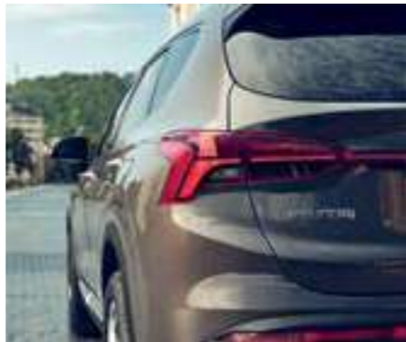
Đèn hậu công nghệ LED 3D