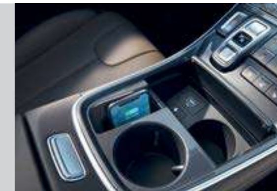
Sạc không dây chuẩn Qi