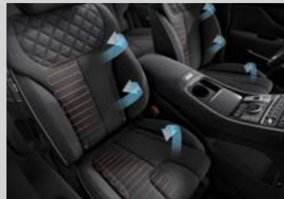
Làm mát và sưởi hàng ghế trước (Bản cơ bản và Cao cấp)