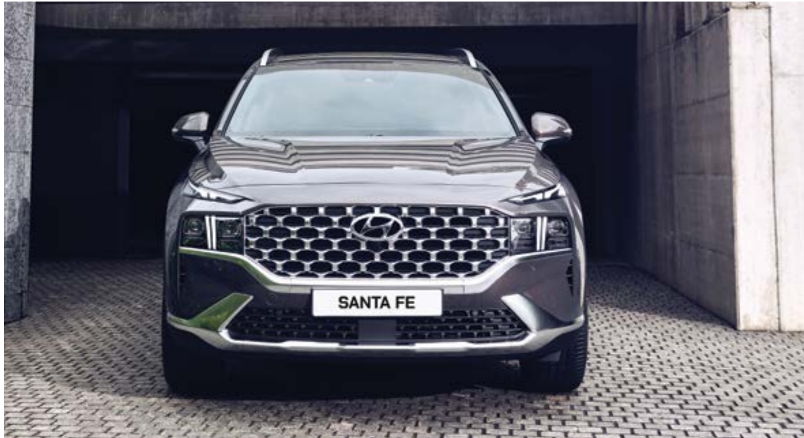
Thiết kế phá cách với thiết kế nhí t m crom to b n Cascading Grill c tr ng c ùng c m òn chi u s áng AHB LED