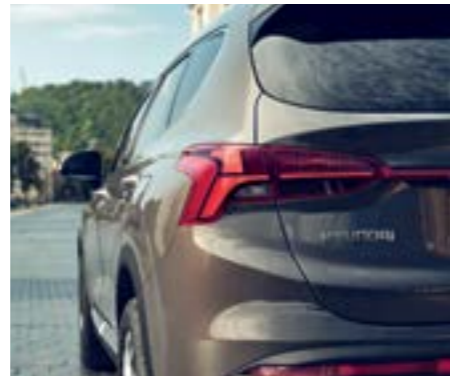
Đèn h u công ngh LED 3D