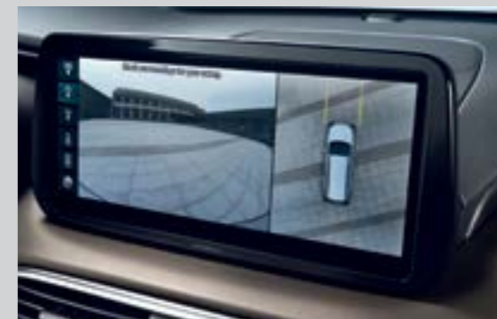
Hệ thống camera 360° (Bản Cao cấp)