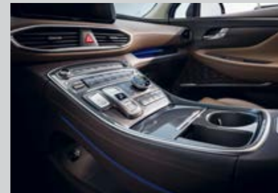
Chức năng điều chỉnh nút bấm cùng đèn vi môi trường light