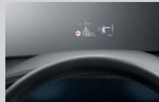
Hiển thị thông tin trên kính lái HUD (Bản Cao cấp)