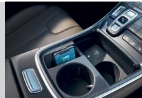
Sạc không dây chuẩn Qi