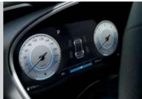
Màn hình thông tin digital 12.35 inch (Bản cơ bản và Cao cấp)