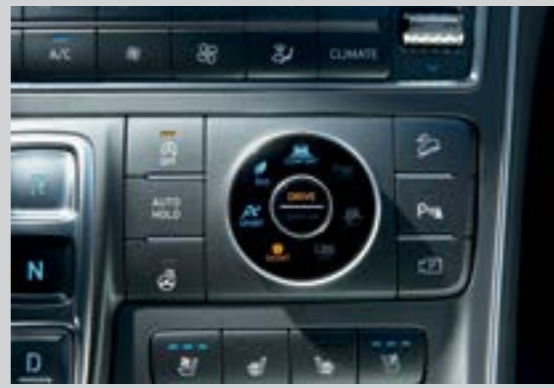
4 chế độ lái (Eco, Comfort, Sport, Smart)