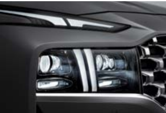
Đèn nhí v ban ngày (DRL) thiết kế ch T C a s tr i toàn c ùnh Panorama cùng thanh kết n p c a p o x u ngh t c m òn chi u treo giá nóc (B n c b i và Cao c p) s áng