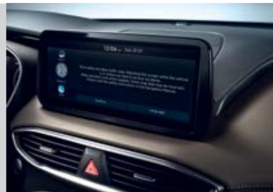
Màn hình giải trí 10.25 inch

Không gian nội thất của New Santa Fe là sự kết hợp hoàn hảo của sang trọng cùng với công nghệ hiện đại mang đến cho khách hàng sự tiện nghi tối đa.