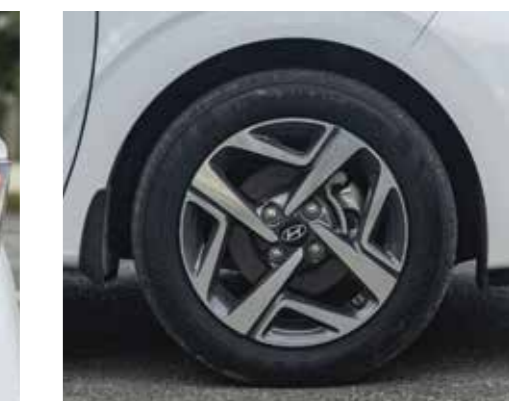
Mâm xe hợp kim 15" thể thao