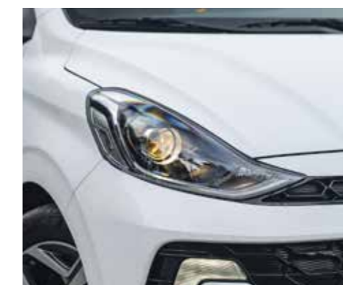
Đèn chiếu sáng Halogen projector