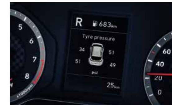
Cảm biến áp suất lốp TPMS