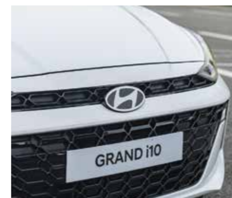
Lưới tản nhiệt màu đen bóng

Thiết kế mới mẻ, kích thước nhỏ gọn tạo nên vẻ ngoài tươi mới, trẻ trung, tự tin và cá tính.