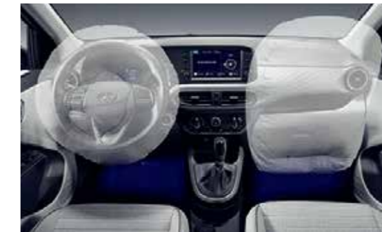
Hệ thống 4 túi khí