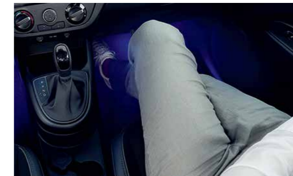
Đèn nội thất