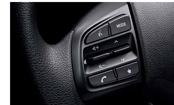
Cụm điều chỉnh media tích hợp nhận diện giọng nói