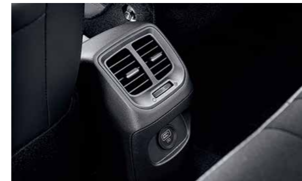
Cửa gió điều hòa hàng ghế thứ 2