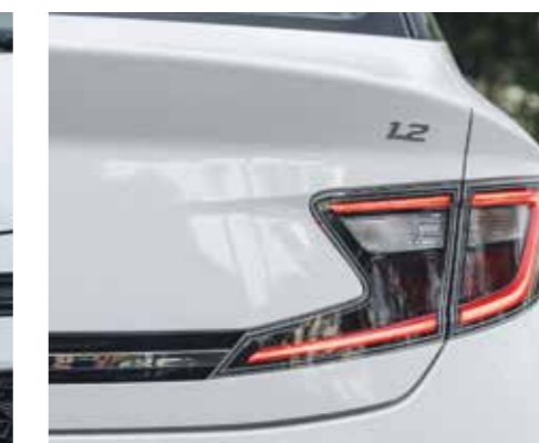
Cụm đèn hậu LED