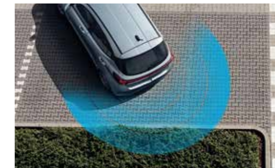
Cảm biến lùi