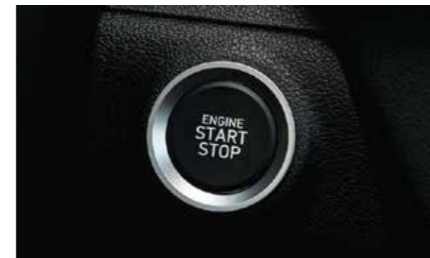
Khởi động bằng nút bấm