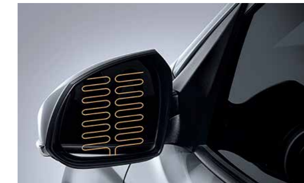
Gương chiếu hậu chỉnh điện gập điện, sấy điện