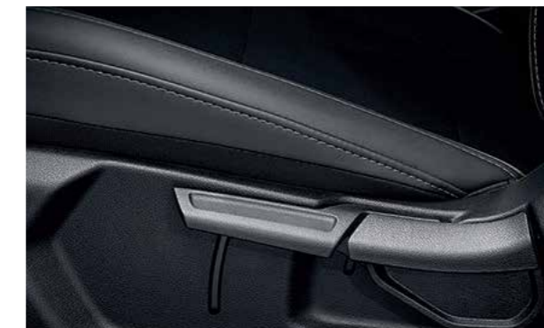
Ghế lái điều chỉnh 6 hướng