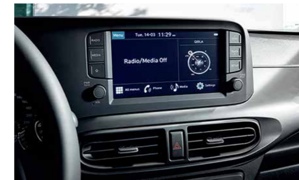
Màn hình giải trí 8 inch