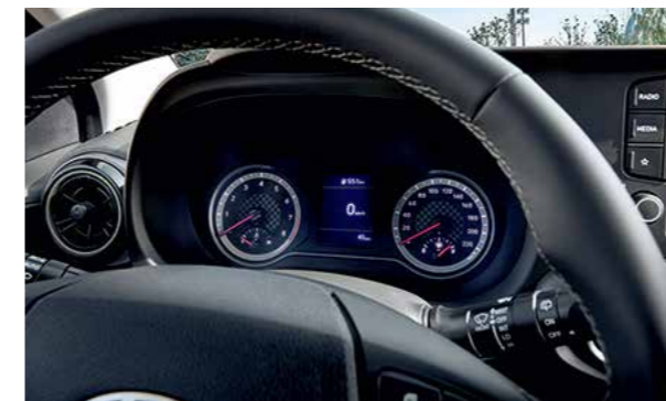
Màn hình thông tin 3.5 inch

Nội thất hiện đại, hoàn thiện kết hợp với không gian rộng rãi làm cho những chuyến đi dài trở thành một trải nghiệm thú vị.