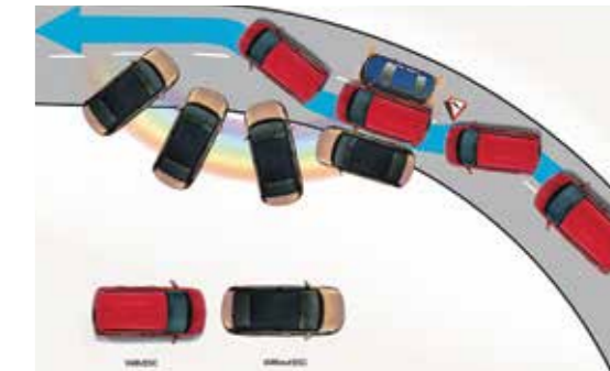
Hệ thống cân bằng điện tử ESC