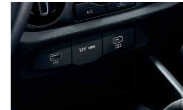
Cổng sạc Type C