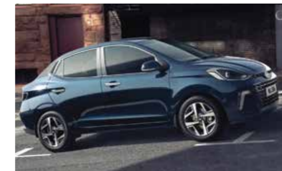
Hệ thống hỗ trợ khởi hành ngang dốc HAC