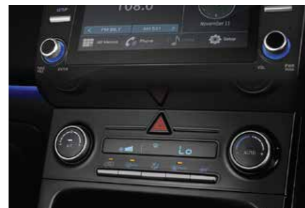
Điều hòa tự động (Bản Đặc Biệt và Cao cấp)