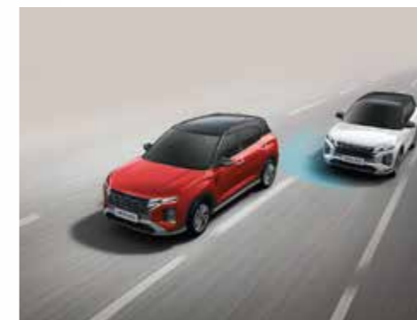
Hỗ trợ phòng tránh điểm mù BCA (Bản Cao Cấp)

Động cơ xăng SmartStream G1.5 sản sinh công suất cực đại 115 mã lực tại 6300 vòng/phút và đạt momen xoắn cực đại 144Nm tại 4500 vòng/phút