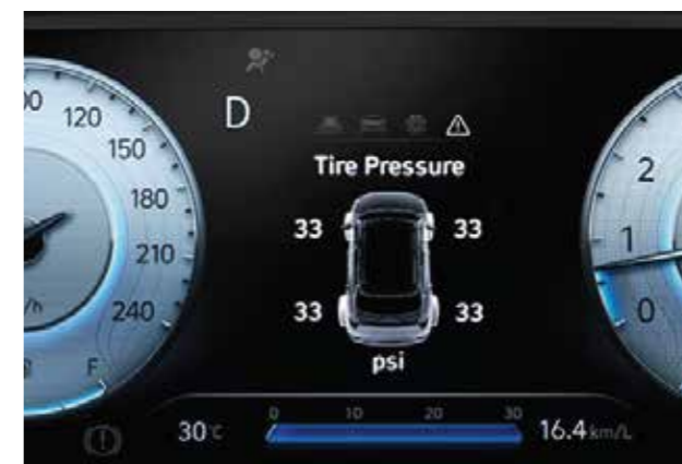
Hệ thống cảm biến áp suất lốp