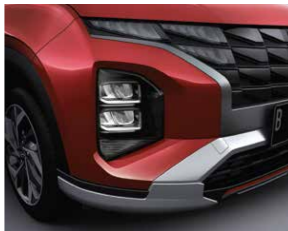
Đèn chiếu sáng LED (Phiên bản Đặc biệt/Cao cấp)