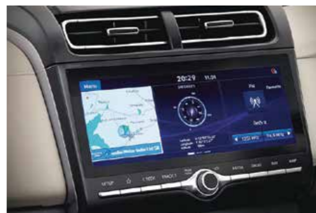
Màn hình giải trí 10.25 inch

CRETA mang đến sự thoải mái tối đa bằng không gian rộng rãi cùng các tiện ích hàng đầu phân khúc