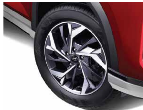
Vành hợp kim 17 inch 2 tone màu (Phiên bản Đặc biệt/Cao cấp)