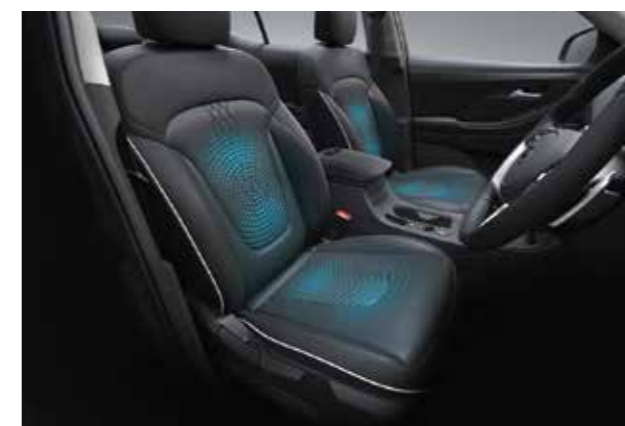
Làm mát hàng ghế trước (Bản Cao cấp)