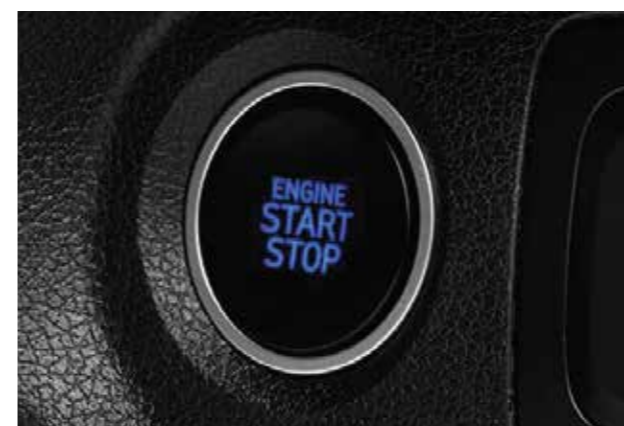
Khởi động bằng nút bấm