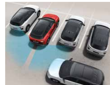
Hỗ trợ phòng tránh và chạm phía sau RCCA (Bản Cao Cấp)