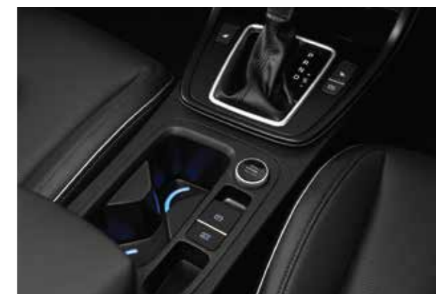
Phanh tay điện tử