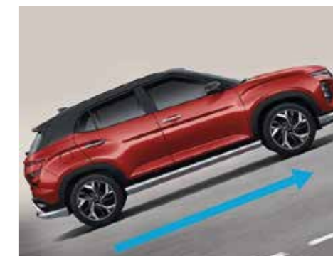
Khởi hành ngang dốc HAC