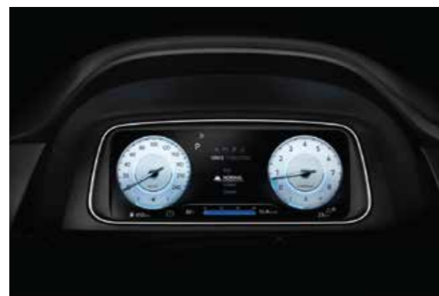
Màn hình thông tin digital 10.25 inch (Bản Cao cấp)