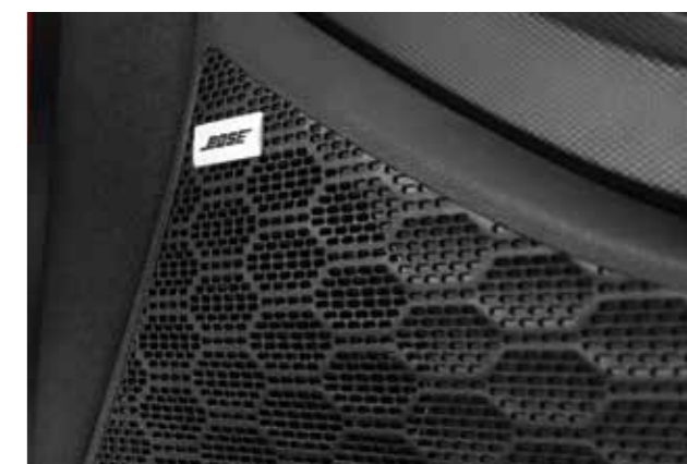
Hệ thống loa Bose cao cấp (Bản Đặc Biệt và Cao cấp)