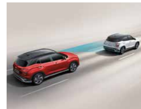
Hỗ trợ phòng tránh và chạm phía trước FCA (Bản Cao Cấp)