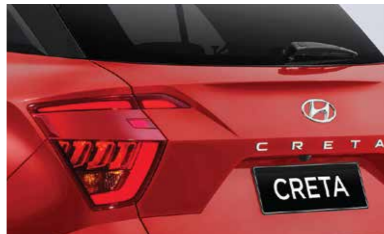
Cụm đèn hậu dạng LED (Phiên bản Đặc biệt/Cao cấp)