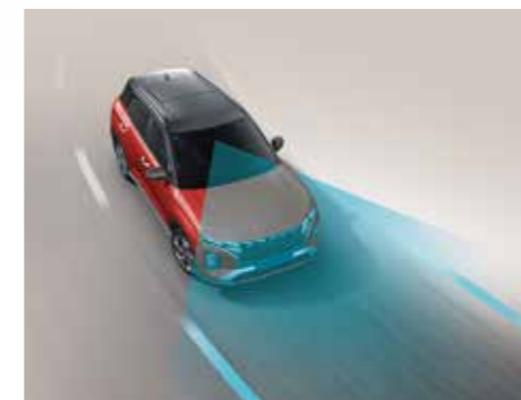
Hỗ trợ giữ làn đường LFA (Bản Cao Cấp)