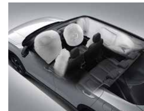
Hệ thống 6 túi khí (Bản Đặc biệt/Cao cấp)