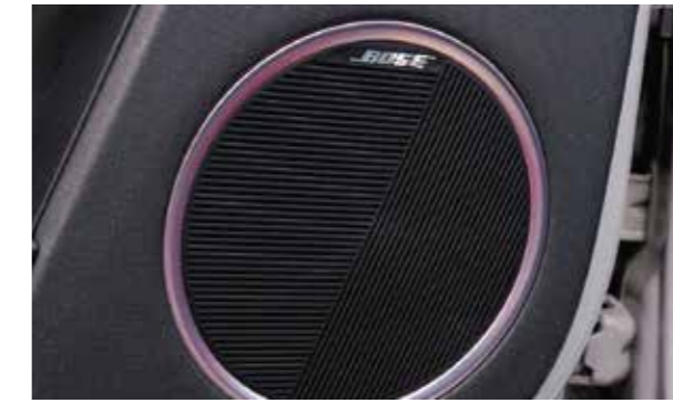
Hệ thống loa Bose cao cấp