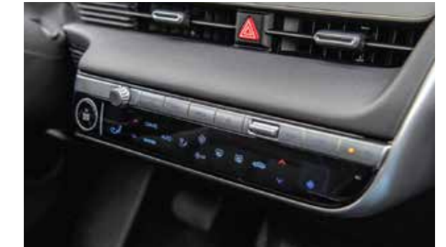
Điều hòa tự động 2 vùng độc lập