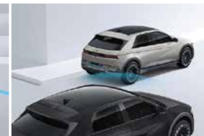
Hỗ trợ phòng tránh và chạm khi rời khỏi xe SEA