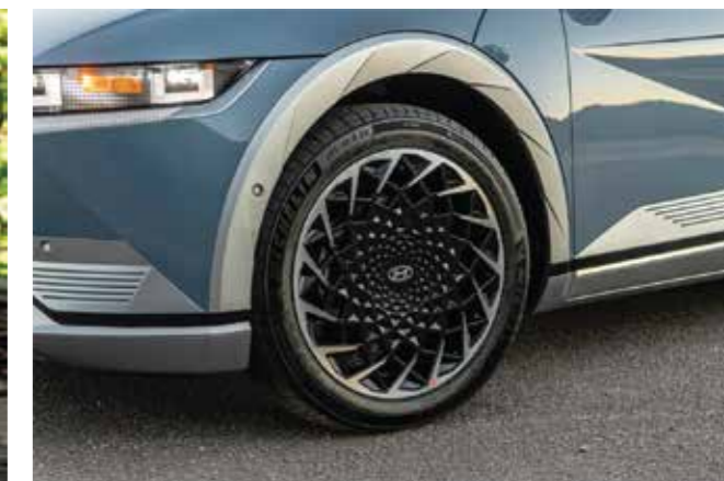
Vành hợp kim 20 inch (Phiên bản Prestige)