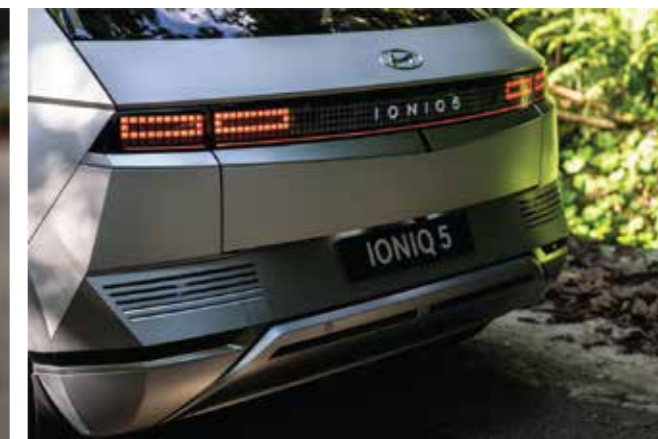
Cụm đèn hậu LED thiết kế Pixel