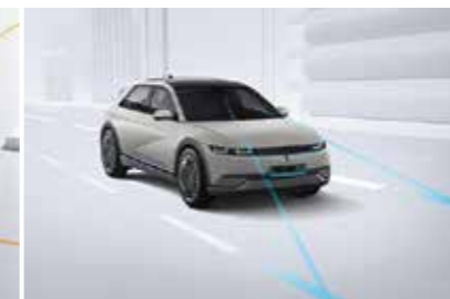
Hỗ trợ giữ làn đường LFA