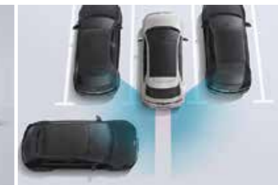
Hỗ trợ phòng tránh và chạm khi lùi xe RCCA