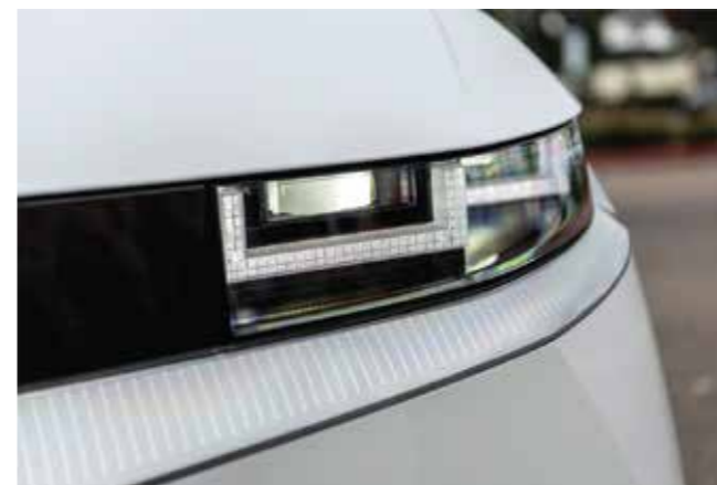
Đèn chiếu sáng LED Projector (Phiên bản Prestige)

Thiết kế bên Parametric Dynamics kết hợp mặt trước và mặt sau tạo nên hình ảnh độc đáo của IONIQ 5.