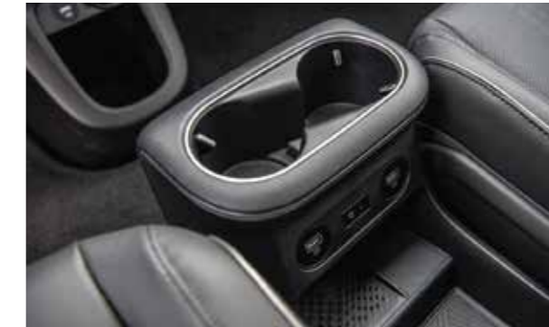
Hộc để cốc tích hợp Sạc không dây