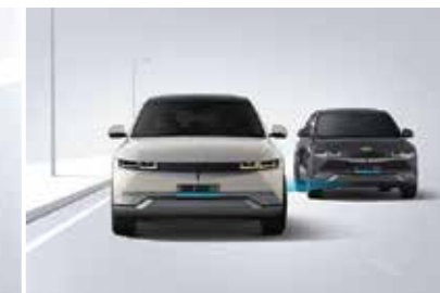
Hỗ trợ phòng tránh và chạm điểm mù BCA