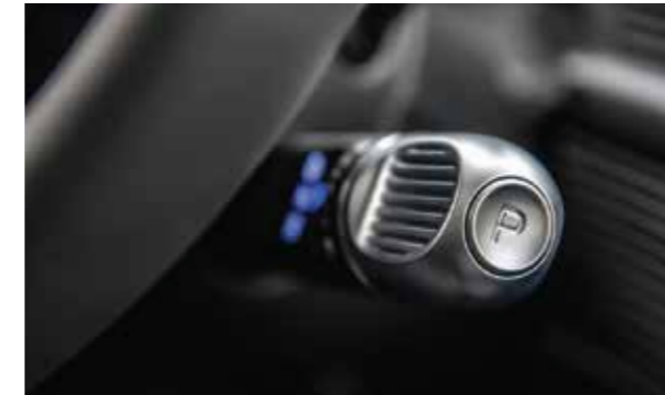
Lấy chuyển số dạng núm xoay