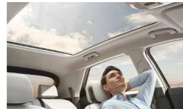
Cửa sổ trời toàn cảnh