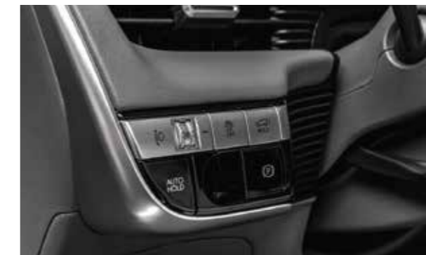
Phanh tay điện tử