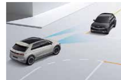
Hỗ trợ phòng tránh và chạm phía trước FCA

217 PS 350 Nm Công suất cực đại Momen xoắn cực đại