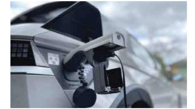
Tính năng V2L mới lạ