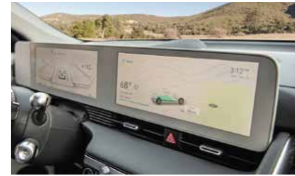
Màn hình đôi 12.3 inch hiện đại sắc nét