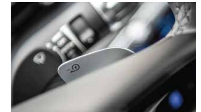
Lấy số điều chỉnh phanh tái sinh