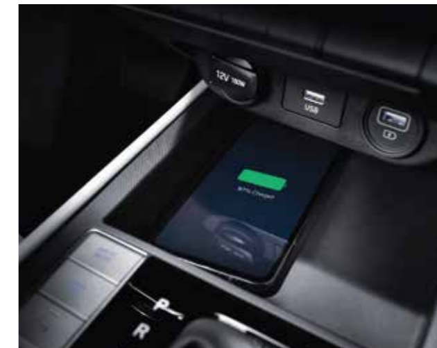
Sạc không dây