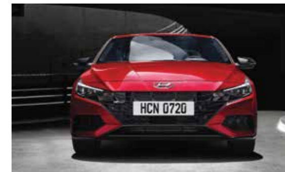
Cản trước với hốc hút gió lớn