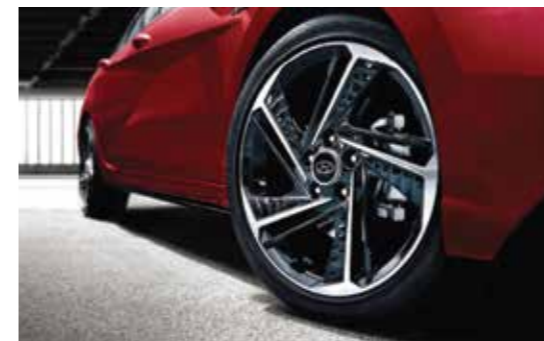
Vành hợp kim 18 inch