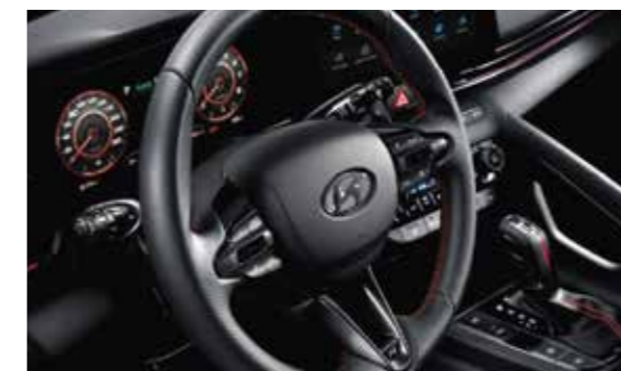
Vô lăng 3 chấu thù chỉ đỏ