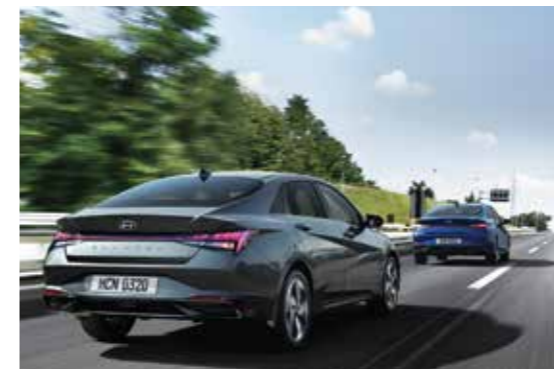
Điều khiển hành trình