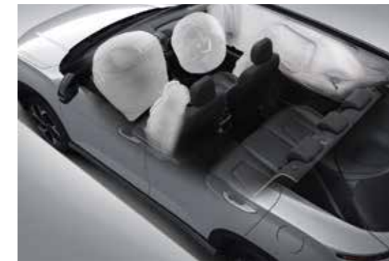
6 túi khí