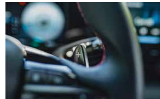
Lẫy chuyển số sau vô lăng