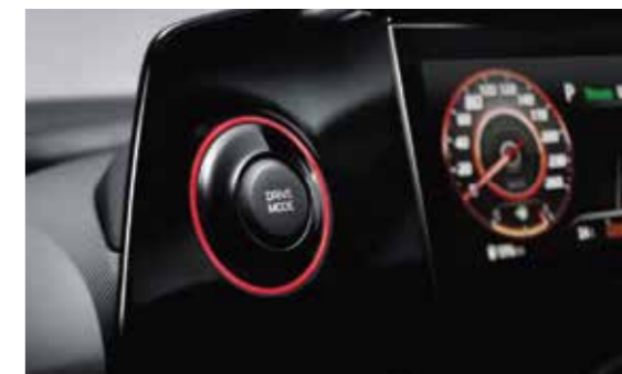
Nút bấm chuyển chế độ lái