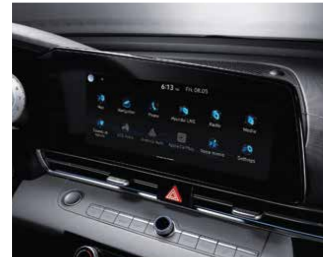
Màn hình giải trí 10.25 inch

Với các đường nét đơn giản nhưng đầy tính thể thao gợi cảm, All New Elantra mang đến một không gian nội thất hài hòa cùng không khí thể thao tràn ngập trong khoang lái