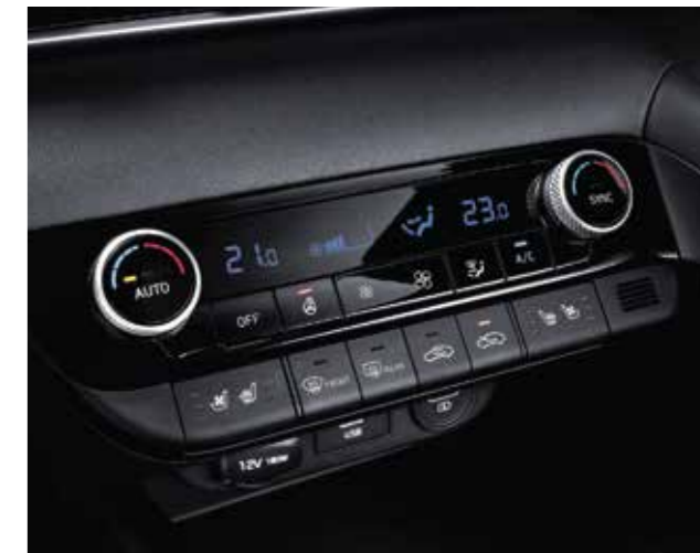
Điều hòa tự động