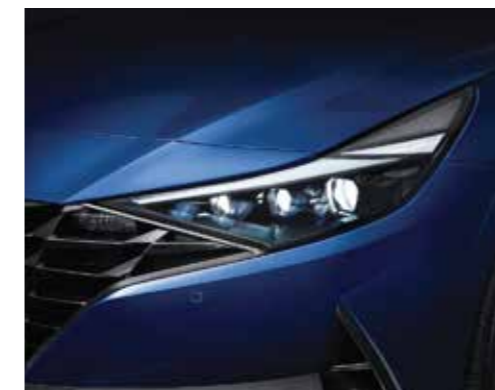
Đèn chiếu sáng LED (Phiên bản 1.6 AT/2.0 AT/N Line)

Thiết kế khác biệt với phần lưới tản nhiệt “Parametric Dynamics” tạo thiết kế mạnh mẽ, góc cạnh, thể thao cho Elantra