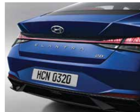
Cụm đèn hậu dạng LED (Phiên bản 1.6 AT/2.0 AT/N Line)