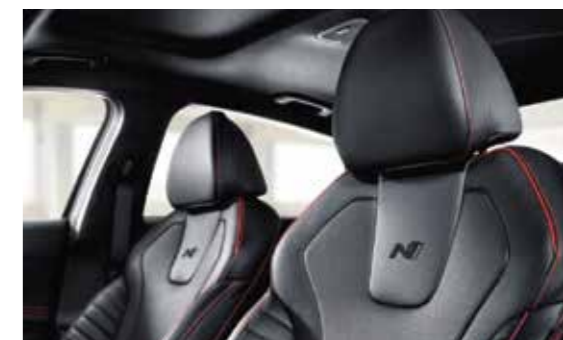
Ghế da thể thao N Line