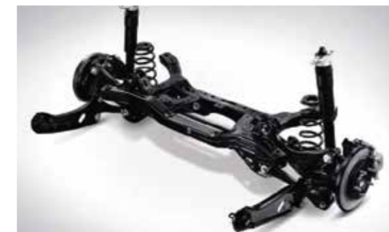
Hệ thống treo sau liên kết đa điểm