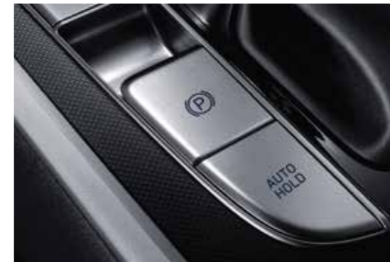
Phanh tay điện tử