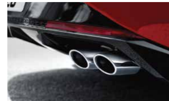
Chụp ống xả kép thể thao