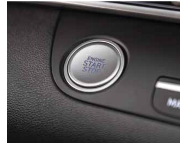
Khởi động bằng nút bấm