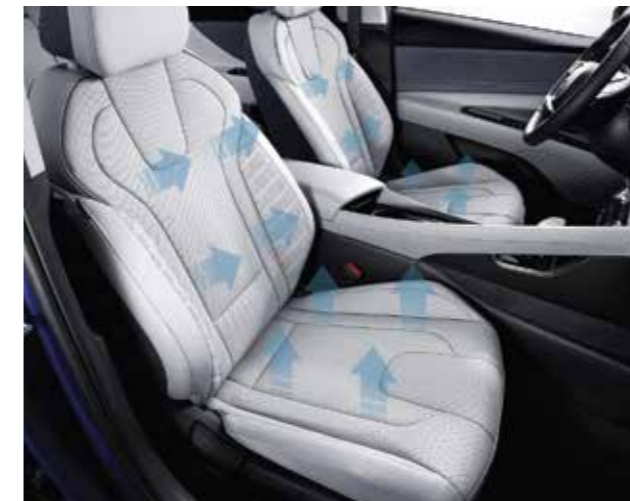
Sưởi và làm mát ghế