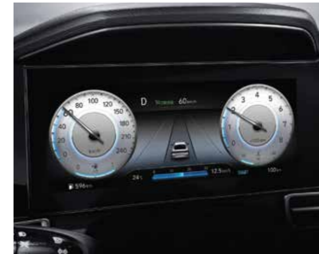
Màn hình thông tin digital 10.25 inch