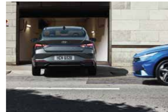
Cảm biến lùi