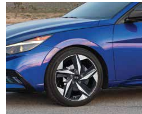
Vành hợp kim 17 inch 2 tone màu (Phiên bản 2.0 AT)