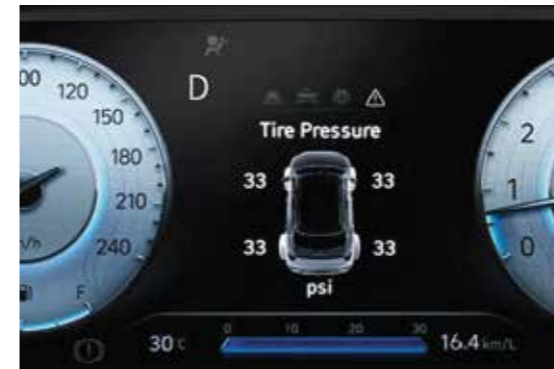
Hệ thống cảm biến áp suất lốp

Elantra hoàn toàn mới được trang bị khung gầm hoàn toàn mới để đảm bảo sự chắc chắn đi cùng hệ thống an toàn. Bên cạnh đó, động cơ Smartstream 1.6 T-GDi mới giúp Elantra trở thành chiếc xe mạnh mẽ nhất phân khúc