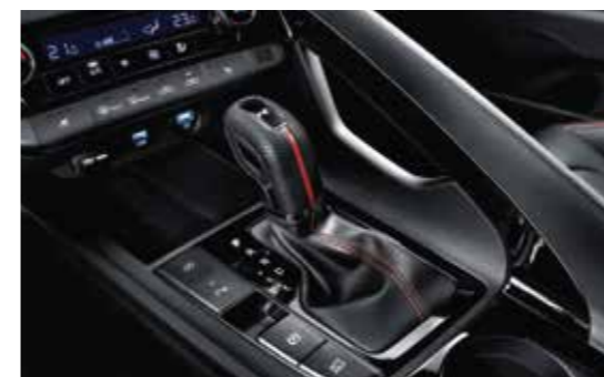
Cần số thể thao N Line