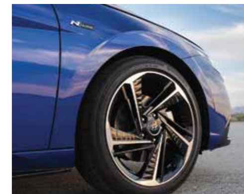
Vành hợp kim 18 inch 2 tone màu (Phiên bản N Line)