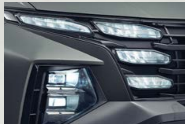
Đèn chiếu sáng LED Projector

Tiên phong với thiết kế đèn ban ngày dạng ẩn “Parametric Jewel” giúp định hướng phong cách thể thao gợi cảm (Sensuous Sportiness) cho Hyundai Tucson mới.