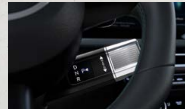
Cần số điện tử sau vô lăng