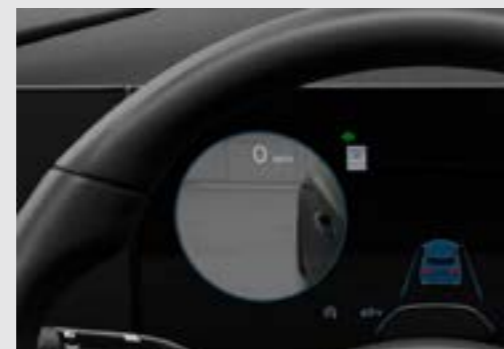
Hiển thị điểm mù trên màn hình thông tin (BVM)