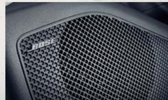
Hệ thống loa Bose cao cấp