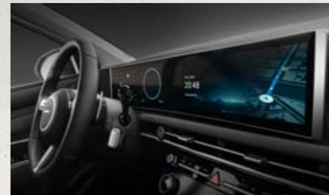
Màn hình giải trí cảm ứng 12.3 inch và màn hình đa thông tin 12.3 inch cong liền khối