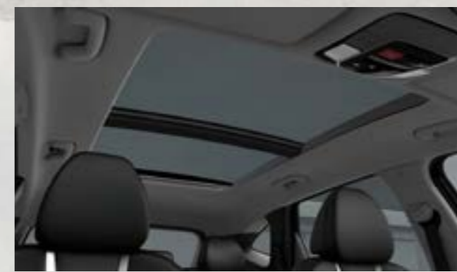
Cửa sổ trời toàn cảnh Panorama