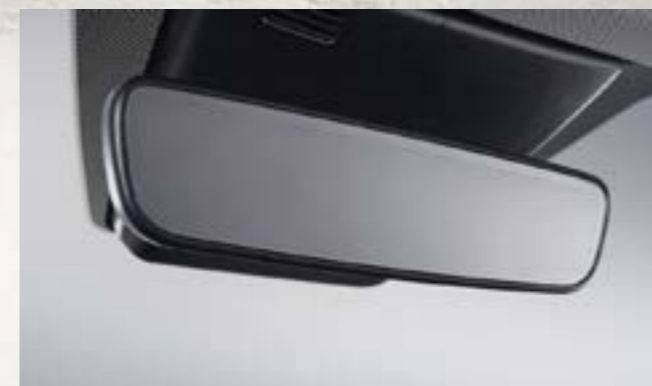
Gương chiếu hậu chống chói tự động (ECM)