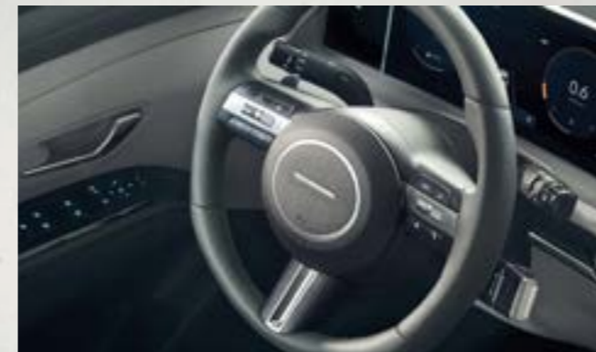
Vô lăng 3 chấu thể thao

Hyundai Tucson mang đến sự thoải mái tối đa bằng không gian mở rộng rãi với phần bệ tay được làm “nổi” tách biệt cùng các tiện ích hàng đầu phân khúc.