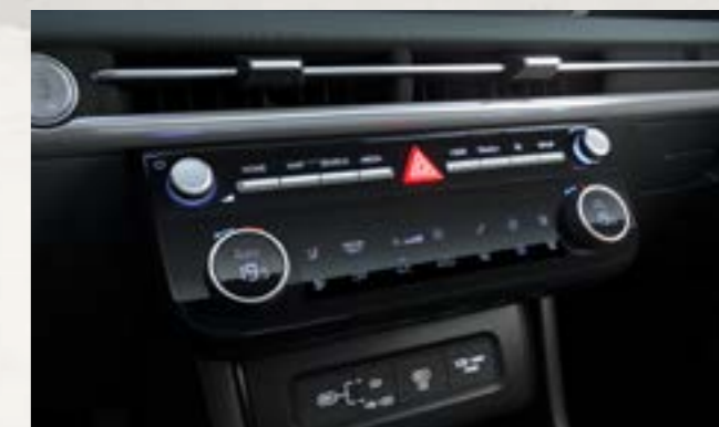
Điều hòa tự động 2 vùng độc lập