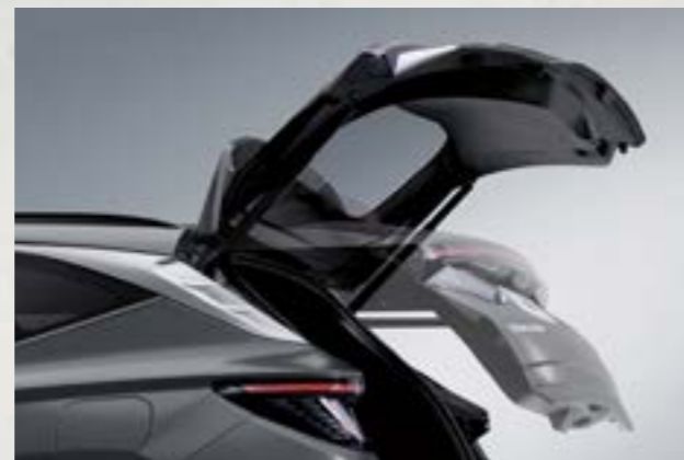
Cốp điện thông minh