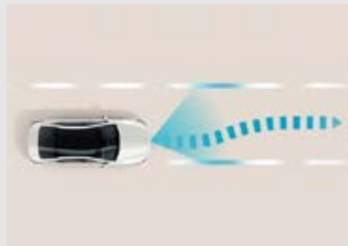
Hỗ trợ giữ làn đường (LKA)