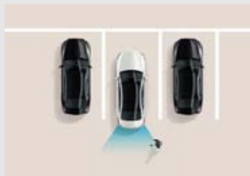
Hỗ trợ phòng tránh va chạm khi đỗ xe (PCA)