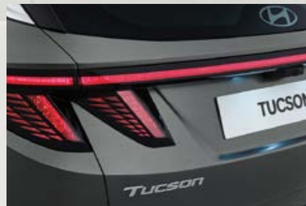
Cụm đèn hậu công nghệ LED