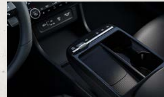
Sạc không dây chuẩn Qi