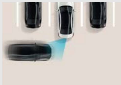
Hỗ trợ phòng tránh va chạm khi lùi (RCCA)