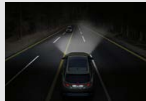
Đèn pha tự động thích ứng (AHB)

Động cơ xăng SmartStream 1.6 T-GDi cùng với hệ dẫn động toàn thời gian HTRAC sản sinh công suất cực đại 180 mã lực tại 5500 vòng/phút và đạt momen xoắn cực đại 265Nm tại 1500 - 4500vòng/phút