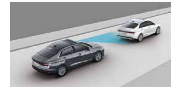
Hệ thống hỗ trợ phòng tránh va chạm phía trước FCA