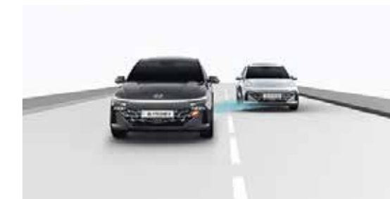
Hệ thống hỗ trợ phòng tránh va chạm điểm mù BCA