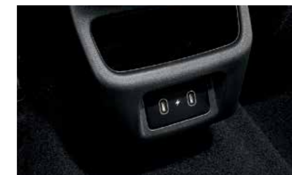
Cổng sạc Type C