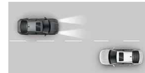
Đèn pha tự động thích ứng HBA