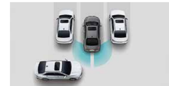
Hệ thống hỗ trợ phòng tránh va chạm khi lùi RCCA