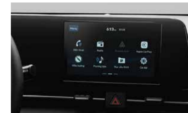
Màn hình giải trí 8 inch