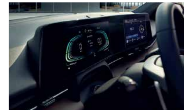
Màn hình thông tin 10.25 inch