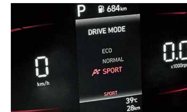
3 chế độ lái: Eco, Normal, Sport