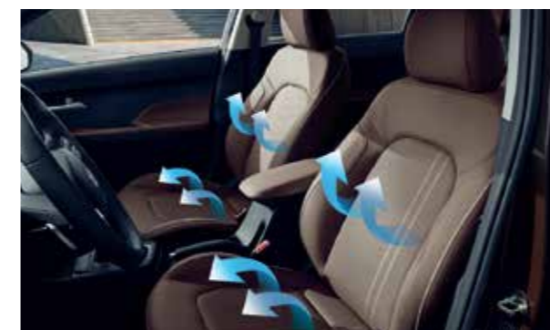
Làm mát hàng ghế trước