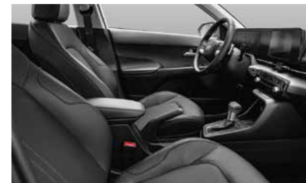
Ghế da cao cấp

Bước vào Accent hoàn toàn mới và trải nghiệm sự hiện đại, tiện nghi. Các đường nét, kết cấu phối hợp cùng màu sắc mang đến cảm giác đầy hứng thú.