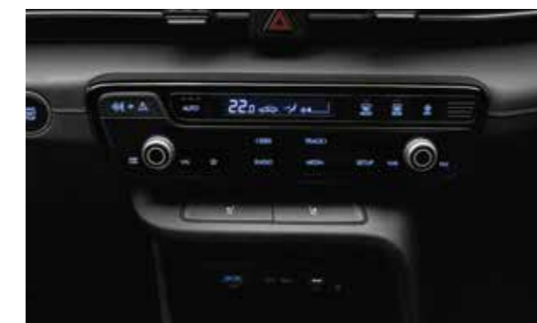
Hệ thống điều hòa tự động