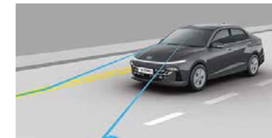
Hệ thống hỗ trợ duy trì làn đường LFA