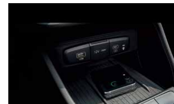
Sạc không dây