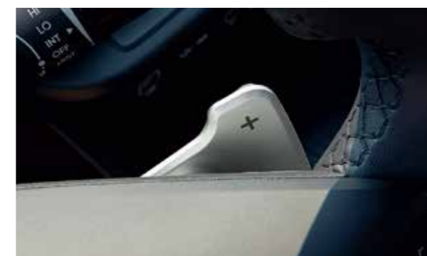
Lấy chuyển số sau vô lăng