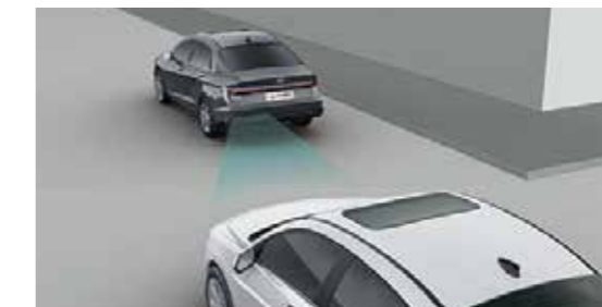
Hệ thống cảnh báo mở cửa an toàn SEW