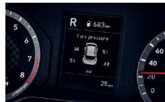
Cảm biến áp suất lốp TPMS