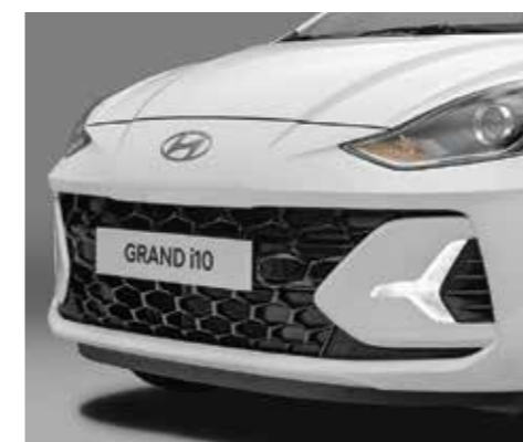
Lưới tản nhiệt màu đen bóng