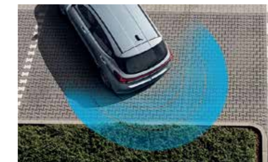
Cảm biến lùi