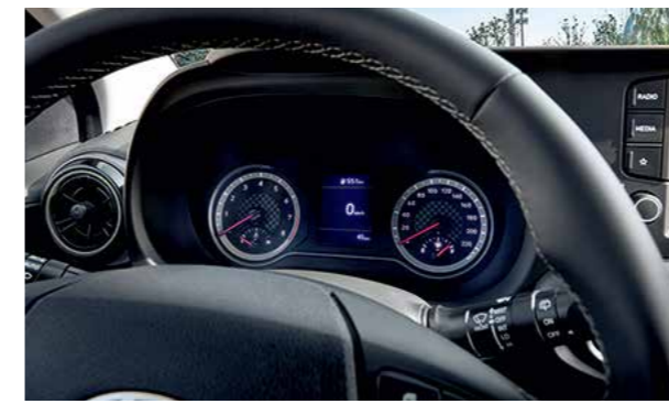
Màn hình thông tin 3.5 inch

Nội thất hiện đại, hoàn thiện kết hợp với không gian rộng rãi làm cho những chuyến đi dài trở thành một trải nghiệm thú vị.