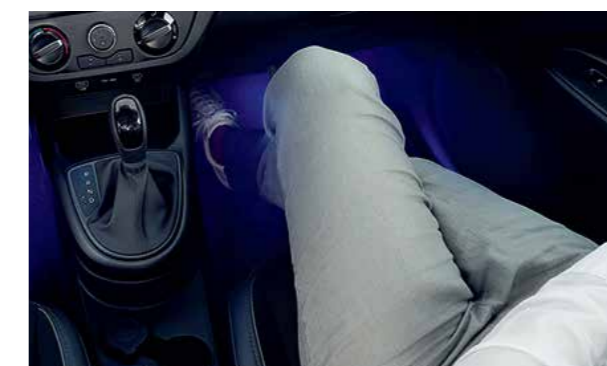
Đèn nội thất