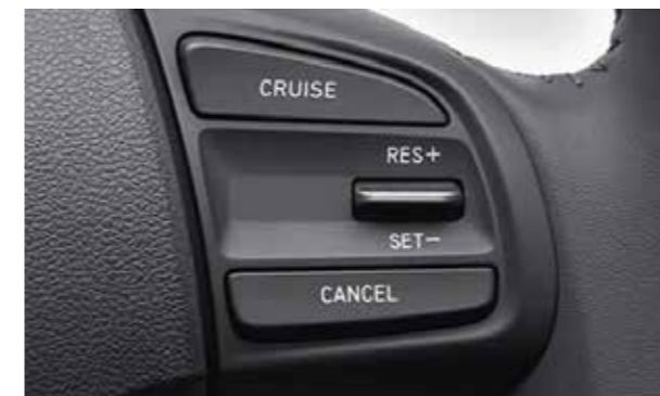
Điều khiển hành trình