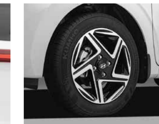
Mâm xe hợp kim 15" thể thao