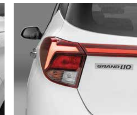
Cụm đèn hậu LED