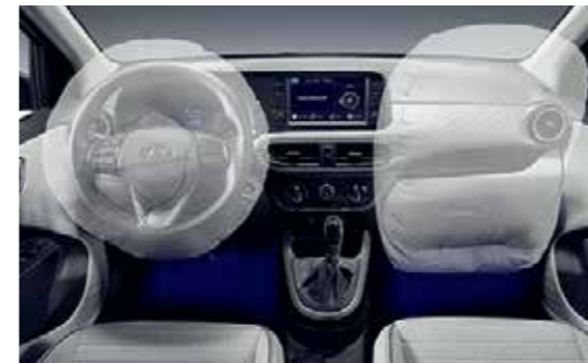
Hệ thống 4 túi khí