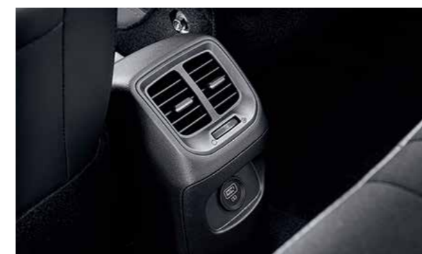
Cửa gió điều hòa hàng ghế thứ 2