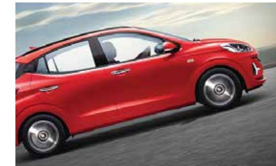
Hệ thống hỗ trợ khởi hành ngang dốc HAC