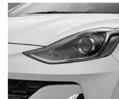
Đèn chiếu sáng Halogen projector